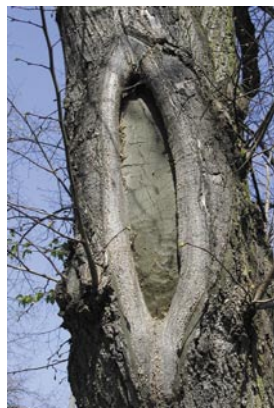
Links: Starkastschnitte führen langfristig zu Fäule. Diese Schnittführung entspricht nicht mehr dem aktuellen Stand der Technik