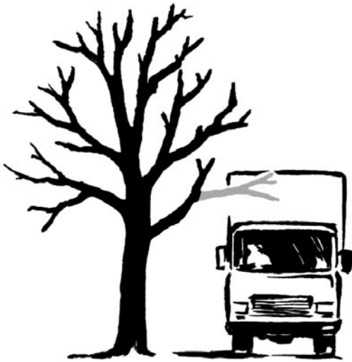
Korrektcr Lichtraumprofilschnitt bei Ästen über 10 cm Durchmesser (Schnitt auf Versorgungsast)

Fast alle Verletzungen von mehr als 10 cm Durchmesser bergen das Risiko, dass holzzeretzende Pilze eindringen und das Holz zersetzen. Dies geschieht oftmals erst nach 10–20 Jahren. Das Risiko von Fäulebildung ist geringer, wenn nur Splintholz verletzt wird und größer, wenn – wie bei einem Starkastschnitt – Kernholz geschädigt wird.