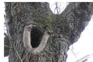
Unten: Faulhöhle an Astansatz

durchgeführt werden. Der Stamm ist das wesentliche Tragegerüst des Baumes. Die Bruchgefahr nimmt zu.